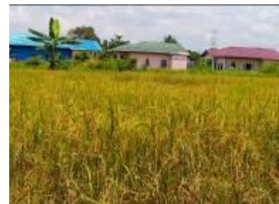
Gambar 3. Padi mutiara