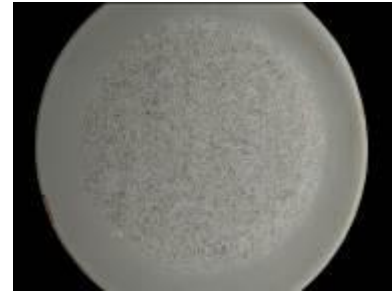
Gambar 8. Hasil pembakaran sekam mutiara

Menurut Nuryono et al. (2004), suhu 600°C merupakan suhu optimum untuk pengabuan abu sekam padi, sedangkan pada pengabuan suhu 500°C masih terdapat karbon yang belum sempurna teroksidasi sehingga kadar silika dalam abu masih relatif rendah. Sebaliknya pengabuan di atas 700°C menghasilkan abu dengan kekristalan tinggi yang sukar untuk didestruksi. Selanjutnya abu yang dihasilkan digerus dan diayak menggunakan ayakan 240 mesh .