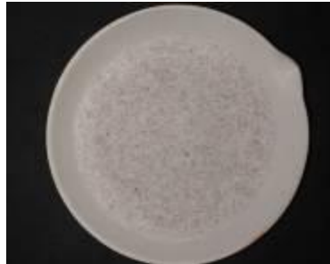
Gambar 7. Hasil pembakaran sekam pandak