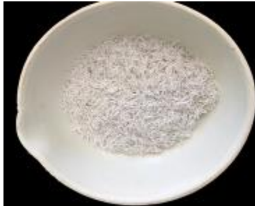
Gambar 6. Hasil pembakaran sekam siam ungu

Sekam yang telah kering dimasukkan ke dalam cawan porselen, kemudian diabukan pada suhu awal 200°C selama 1 jam menggunakan furnace . Setelah itu suhu dinaikkan menjadi 600°C selama 4 jam hingga terbentuk abu berwarna putih.