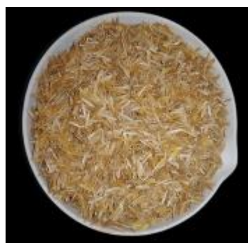
Gambar 5. Sekam Padi Pandak