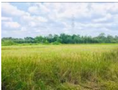
Gambar 1. Padi siam unus

Sekam padi lokal Kalimantan Selatan yang diambil berasal dari 3 (tiga) daerah, sekam padi siam unus di Desa Gambut Kabupaten Banjar, pandak di Desa Kurau Kabupaten Tanah Laut, dan mutiara di Desa Puntik Kabupaten Barito Kuala. Sekam Padi diperoleh dari tempat penggilingan padi di ketiga lokasi tersebut.