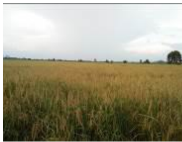
Gambar 2. Padi pandak