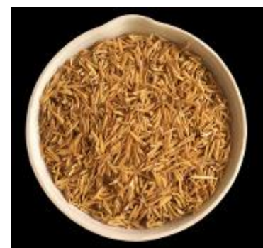
Gambar 5. Sekam Padi Mutiara