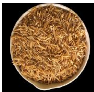
Gambar 4. Sekam Padi Siam Unus

Proses preparasi sekam padi dilakukan dengan membersihkan kotoran ataupun debu dan tanah menggunakan air bersih kemudian direndam dalam air panas selama 2 jam, lalu disaring dan dicuci kembali sebanyak tiga kali menggunakan air panas. Sekam yang telah bersih selanjutnya dikeringkan di bawah sinar matahari, lalu dilanjutkan pengeringan menggunakan oven pada suhu 110°C selama 3 jam (Pratomo et al. , 2013).