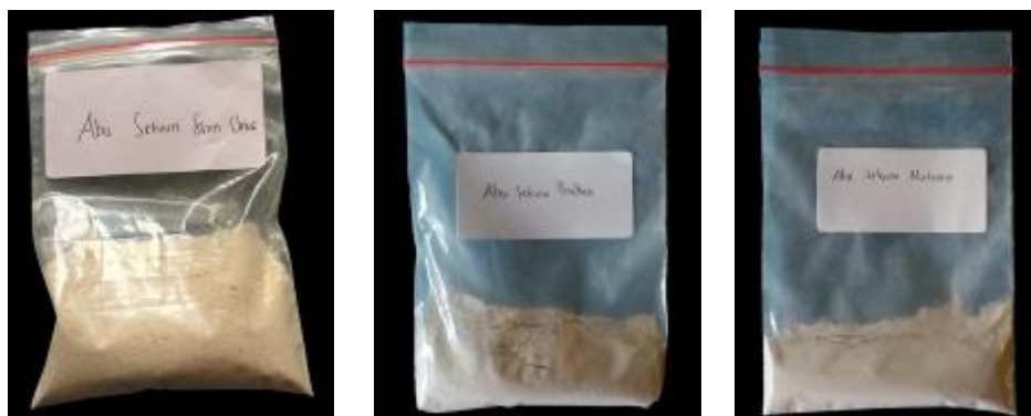
Gambar 9. Hasil ayakan abu sekam padi 240 mesh

Menurut Nuryono et al. (2004), suhu 600°C merupakan suhu optimum untuk pengabuan abu sekam padi, sedangkan pada pengabuan suhu 500°C masih terdapat karbon yang belum sempurna teroksidasi sehingga kadar silika dalam abu masih relatif rendah. Sebaliknya pengabuan di atas 700°C menghasilkan abu dengan kekristalan tinggi yang sukar untuk didestruksi. Selanjutnya abu yang dihasilkan digerus dan diayak menggunakan ayakan 240 mesh .